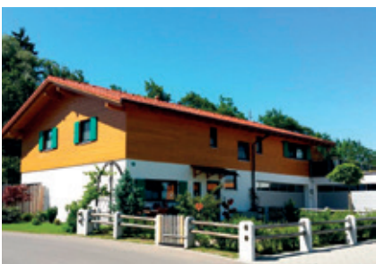
Am Steinbruch, Burgberg